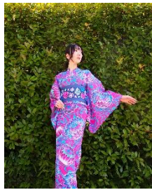
浴衣「velvet flower」/半幅帯「多肉」 浴衣 55,000 円/半幅帯 26,400 円

着物デザイナー石川成俊が手掛けるブランド「iroca」が期間限定ショップをオープン。「サイケデリック」をテーマに、花と深海という二つの世界観を表現した新作浴衣や新作帯を展開するほか、約20柄のオリジナルデザイン浴衣を販売。ゲストブランドとして立体刺繍作家「PieniSieni」も参加し、花をモチーフにしたアクセサリーなど、夏の装いを彩るアイテムを取り揃えます。