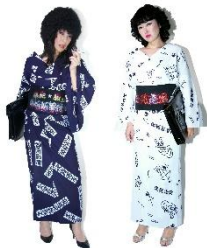
夜露死苦浴衣・紺 79,790円 夜露死苦浴衣・白 79,790円

創業四半世紀を迎えた月影屋が、POP UP SHOPを開催。伊勢型紙、注染、バット1色染め、手縫い仕立てなど、職人による伝統技法に裏打ちされた高いクオリティと、和服の世界では類を見ない唯一無二のスタイルで、国内外の著名人やファッションアイコン、歌舞伎役者、祇園の女将など幅広い層から支持を獲得。今回のPOP UP SHOPでは、帯と揃いで楽しめる“クリスタルがギラギラ輝く数奇屋袋”も新登場。創業25周年を迎えた今年、例年以上に華やかで遊び心あふれるラインアップを展開いたします。