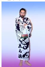
日本駄衛門の浴衣・白 79,790円 お稲荷様の帯 89,300円