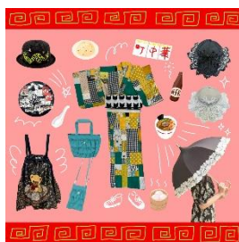
浴衣 29,700 円～