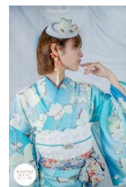
ドットグレープ綿着物(セミオーダー) 48,400 円 トク帽 ホワイト 4,730 円 金魚のイヤーフック 5,500 円 レース半幅帯 白スカラブ 13,200 円 金彩磁帯留 リボン 6,600 円 アンティーク着物 志古貴水色 6,380 円