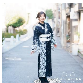
レース着物 50,600 円 バスル帯 24,200 円

また、簡単に華やかな着こなしを楽しめる「ふわふわ帯(作り帯)」「楽帯」「バスル帯」「ドレスシー帯」なども豊富にラインナップ。一点物の作家作品も多数取り揃え、特別感のある和装スタイルをご提案いたします。