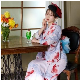
オリジナル浴衣・半巾帯セット 「あぶ金魚」 33,000 円

さらに、着付けやお手入れが簡単で、今話題を集めている「セパレート浴衣」も展開。浴衣初心者の方にも気軽に楽しんでいただける、浴衣専門ショップです。