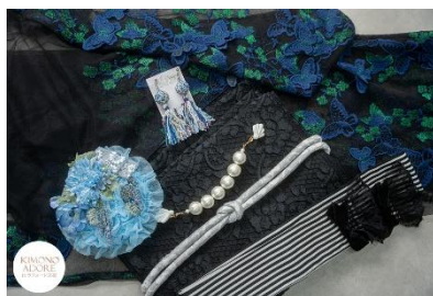
蝶々のチュール羽織 ネイビー 38,500 円 手まりとミックスタッセルのイヤリング 6,600 円 羽織クリップ シェル白 13,200 円 鱗の丸げ帯締め 3,800 円 白黒ストライプ志古貴 4,180 円