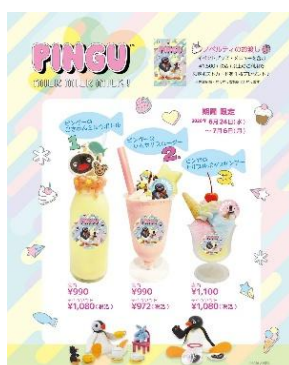
カフェ限定メニュー