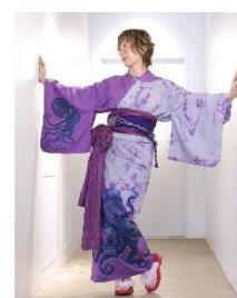
玄以絞り浴衣 (京紫色 蛸) 79,200 円