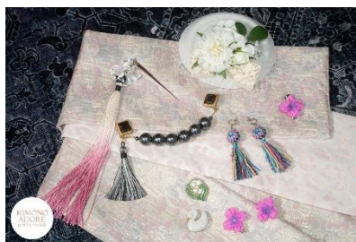
半幅帯ピンクレオパード 9,900 円 百合の簪 5,800 円 羽織クリップ アンティークボタン 13,200 円

作家の感性と技術が光る、一点物の着物や帯が集結。作品を手にとれるだけでなく、着物好きの作家へ直接オーダーできる販売会です。着物や帯は好きな色やサイズで仕立てることができ、自分だけの一着を実現。カジュアルからフォーマルまで、世界にひとつだけの着物スタイルをご提案します。