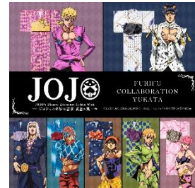
ジョジョの奇妙な冒険 コラボ浴衣 24,200 円