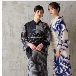
キャロル 66,000 円