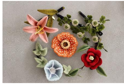
立体刺繍の華アクセサリー 27,500～38,500 円