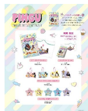
カフェ限定グッズ