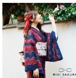
バイカラーレース着物 50,600 円 天使とハートの半幅帯 29,700 円