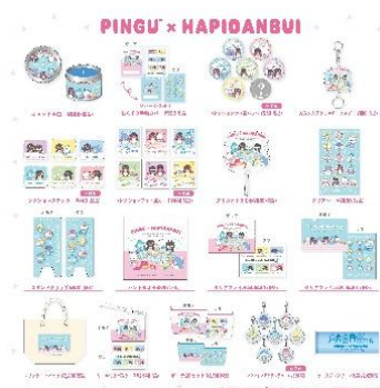
「ピングー」×「はぴだんぶい」 コラボレーショングッズ