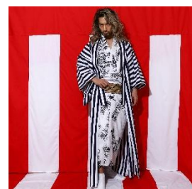
お金の浴衣・白 79,790円 蛇皮の角帯 79,790円