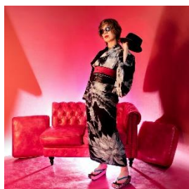
玄以絞り浴衣 (夜長色 月と月下美人) 79,200 円

京都ぬれ描き友禅作家による手描き浴衣を展開。作家が一枚一枚手染め・手描きで仕上げるため、同じ柄でもそれぞれ異なる表情を持つ一点ものの浴衣です。会期中は作家本人によるカスタムオーダーも承り、お客様のご要望に合わせたオリジナル浴衣の制作が可能です。染めと手描きにこだわった、世界に一枚だけの浴衣との出会いをお楽しみいただけます。