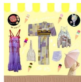
浴衣 29,700 円～