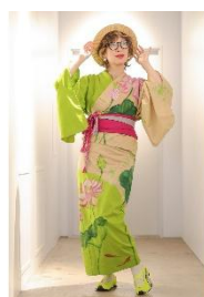
玄以絞り浴衣 (萌黄色 蓮に和金) 79,200 円