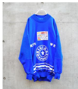
80s Sweat Shirt ¥6,000(税抜)