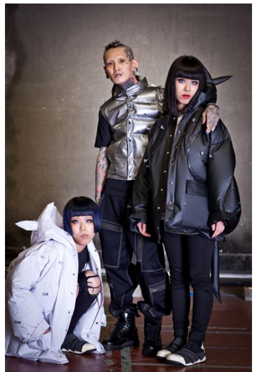
エン・ジーンズ Future Special ¥32,000(税抜)