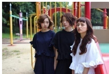
set up ¥13,600(税抜)