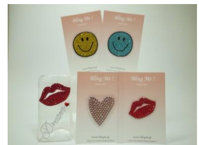
Big リップシール ¥2,000(税抜) Big ハートシール ¥2,000(税抜) Big スマイルシール ¥5,000(税抜)