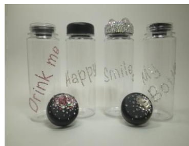
クリアボトル 「Drink me」 ¥12,860(税抜) / 「Happy」 ¥6,500(税抜) 「Smile」 ¥25,500(税抜) / 「My Bottle」 ¥12,990(税抜)