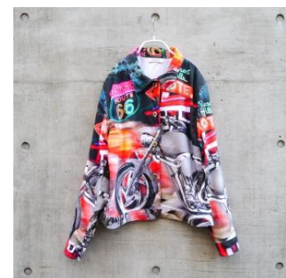
Print Jacket ¥5,900(税抜)