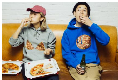
PIZZA Parka ¥9,800(税抜) STONED Cap ¥3,800(税抜)