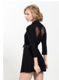
Wings Wrap ¥22,000(税抜)