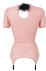
Kristina Suspender Top ¥17,000(税抜)