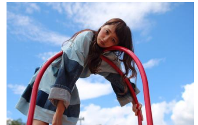
set up ¥12,800(税抜)