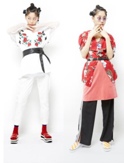
4F WORLD WIDE LOVE! レースアップクレイジーフラワートップス ¥9,990(税抜)

キャンペーンビジュアルは、アートディレクターに大谷有紀氏を迎え、“春＝新生活、はじまりの季節”をキーワードとし、生花と共にフレッシュな気分スタートを切るような一瞬を切り取ったビジュアルとなっています。靴下を花器に見立て、花を生けることによって、非日常なインパクトのあるデザインに落とし込み、ラフォーレと共にはじめの一步を踏み出せるような前向きな気持ちを感じさせてくれます。