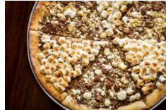
MAX BRENNER CHOCOLATE PIZZA BAR 「ローストヘーゼルナッツ チョコレートチャンク(スライス)」