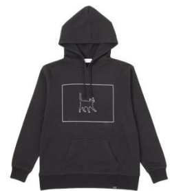
Cage Cat BIG Hoody 8,629円(税込)

2019.4.19(Fri) – 4.25(Thu) 1F entrance space