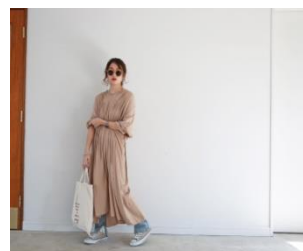
shirring dress 11,800円(税込)