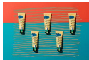
SKIN PERFECTOR -MATTE- 2,484円(税込)