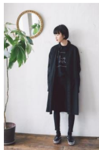
Cage Cat BIG T-shirt 6,469円(税込) Long Slit Shirt 10,584円(税込)