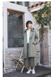
Bal Collar Over Coat 21,384円(税込)