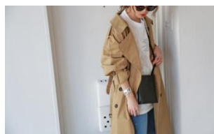
Gigi trench coat 14,900円(税込)