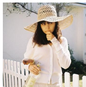
ライトリブニットカーディガン 10,800 円(税込)