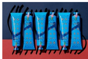
GENTLE CLEANSER 2,052円(税込)