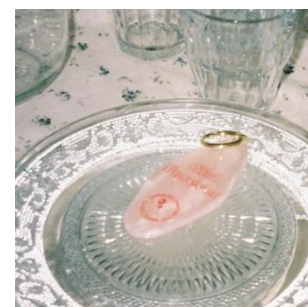
motel key 1,944 円(税込)