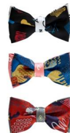
BOTCHAN × giraffe 蝶タイ シリーズ 9,180円(税込)