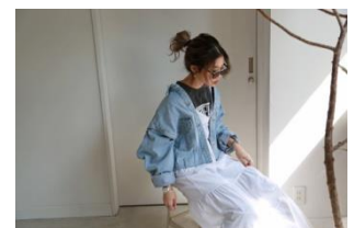
switching denim JK 11,800円(税込)