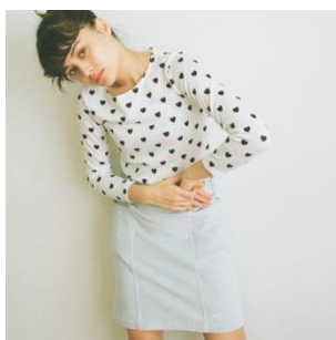
CC コーデユロイスカート 7,776 円(税込)