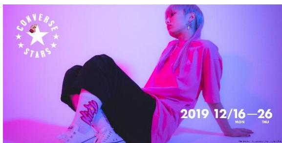
「星のカービィ」× CONVERSE STARS フーディ 10,780 円(税込)