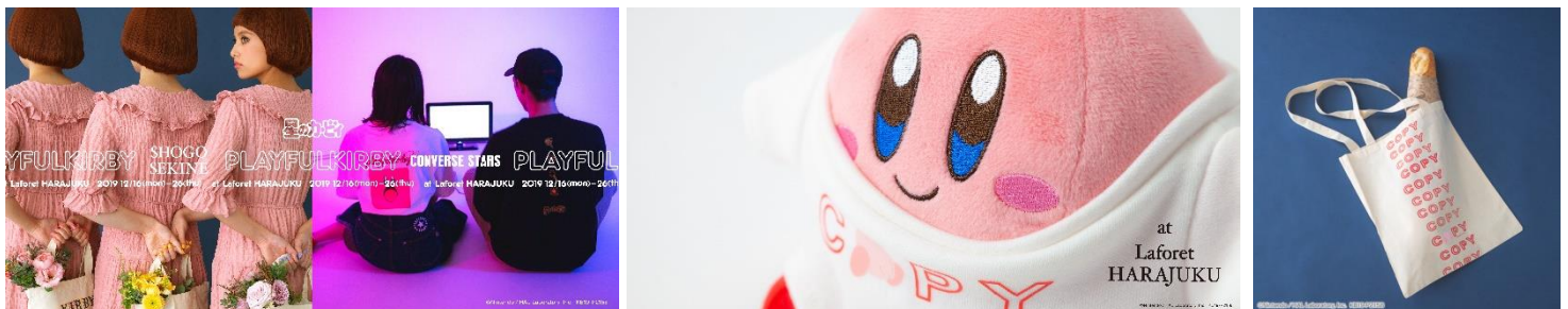
「星のカービィ」×関根正悟 トートバッグ 1,650 円(税込)