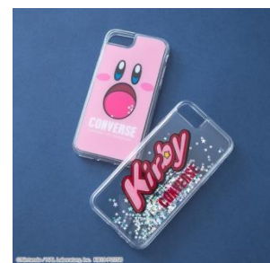
「星のカービィ」× CONVERSE STARS スマホケース 各 4,180 円(税込)