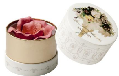
フェイス カラー ローズ ラデュレ（ミニ） セット価格：3,360円

バラの花びらをかたどった「フェイス カラー ローズ ラデュレ（ミニ）」は小さなつぼみに仕上げたニューショップオープン時だけの大人気商品。まるで本物のバラの花弁のようなつぼみのチークでレ・メルヴェイユーズ ラデュレの世界をご堪能いただける限定商品です。フェイスカラー3色とボックス6柄からお好きな組み合わせでお選びいただけます。