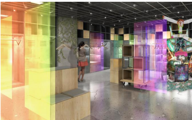
スペースイメージ