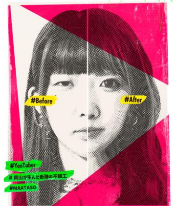
まあたそをフィーチャーしたスペシャル企画を開催