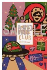
LOVE PIECE CLUB