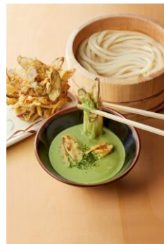
【京都府】 宇治抹茶カルボナーラつけ汁

さくつとフワつとした食感が楽しいわかさぎの天ぶらを山盛りで！徳島県産のすだちをしぼってそのままお召上がりいただくこともできますが、魚介の旨み、のりの香りが楽しい濃厚だしに打ち立てうどんを絡ませ、ぜひわかさぎ天と一緒に楽しみください。