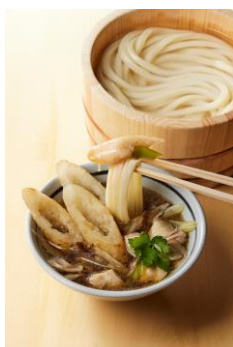
【秋田県】 きりたんぼつけ汁

地鶏のだしに、鶏肉と肉団子、まいたけ、長ねぎ、油あげなど、具沢山。澄んだだしには旨みがギュッと閉じ込められています。打ち立てうどんとの相性も言わずもがな。