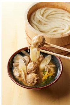
【東京都】 江戸前！塩ちゃんこつけ汁

地鶏のだしに、鶏肉と肉団子、まいたけ、長ねぎ、油あげなど、具沢山。澄んだだしには旨みがギュッと閉じ込められています。打ち立てうどんとの相性も言わずもがな。