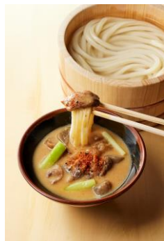
【大阪府】 どて焼きつけ汁

カルボナーラつけ汁をベースに、宇治抹茶を使用。やさしいクリーミーなつけ汁に深みを加える抹茶のつけ汁は京都だけ。香ばしいごぼうのかき揚げ天と打ち立てうどんと共に楽しみください。