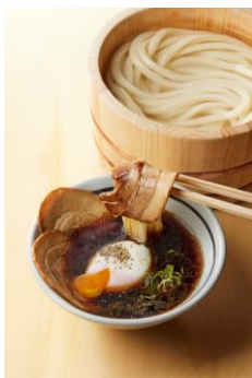
【愛媛県】 煮豚玉子つけ汁

豚バラ肉と長ねぎのおいしさが溶け込んだつけ汁に、香川本鷹をまぶした大根おろしを添えてご提供いたします。強い辛味と旨みたっぷりの香川本鷹と、小麦がふわっと香る打ち立てのうどんをぜひお楽しみください。