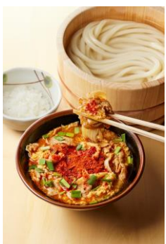
【宮崎県】 宮崎辛麺風つけ汁 ひと口ごはんつき

鶏もも肉に、にんにくとしょうがを効かせた醤油ベースの下味をしっかり付けて天ぷらに。すだちをキュッと絞って、水菜や玉ねぎの野菜と一緒に打ち立てうどんを豪快にお召し上がりください。