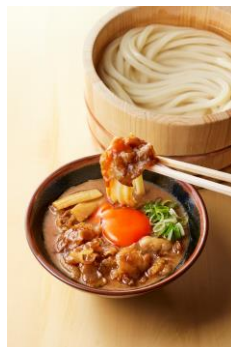
【徳島県】 濃厚 豚玉つけ汁

まいたけの香りが広がる醤油ベースのつけだしに打ち立てうどんをくぐらせ、さっと茹でた白菜と紅葉おろしと一緒にふぐ天をお楽しみください。