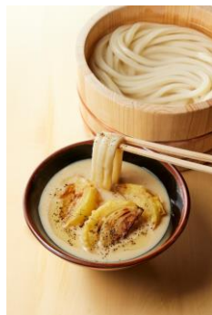
【兵庫県】 玉ねぎ天のポターージュつけ汁

牛のスジ肉やこんにゃく、長ねぎなどを味噌で煮込み、甘辛く濃厚な味わいに仕立てました。旨みと甘み、辛みを楽しんでいただけるつけ汁は、もちもちの打ち立てうどんとの相性も抜群。香七味をたっぷりかけて楽しみください。