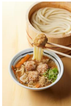
【長崎県】 具沢山だご汁風つけ汁

殻付きの芝えびを使用し、かき揚げに。打ち立てうどんとシャキシャキな水菜、玉ねぎの甘さと芝えびの香ばしさをお楽しみいただけます。最後に柚子の香りが鼻から抜け爽やかさも感じていただけます。