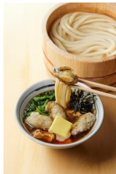
【広島県】 牡蠣バター醤油つけ汁

ぷりっぷりの食感がたまらないホルモンの旨みと、ジューシーな脂が口いっぱい広がります。甘辛のつけ汁がもちもちの打ち立てうどんと絡むことで、コク深い味わいに仕上がっています。