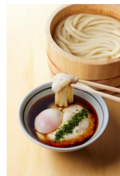
【奈良県】 大和芋たっぷりトロ玉つけ汁

甘さを引き出したクリーミーなポターージュつけ汁に、甘い玉ねぎ天をゴロっと3つ。オリーブオイルとブラックペッパーを仕上げにかけることで、コクをさらに感じていただける仕立てに。濃厚ポターージュは打ち立てうどんとも相性抜群。