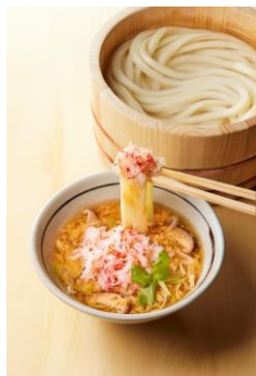
【鳥取県】 かにと玉子のあんかけつけ汁

ずわい蟹をほぐし身にし、香り豊かな白だしをベースに、しいたけの旨みを加えた玉子あんと合わせました。蟹の旨みと打ち立てうどんをシンプルに楽しんでいただける一杯です。