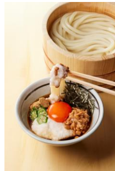
【茨城県】 ねばとろ冷つけ汁

地鶏の旨みたっぷりのだしに、食感と香りが楽しいまいたけ、長ねぎ、ぷりぷりの鶏肉を入れて炊き上げています。もちっとしたきりたんぼは、そのまま食べても、だしに浸して食べてもお楽しみいただけます。