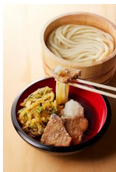
【高知県】 カツオの竜田揚げおろしつけ汁

カツオには醤油をベースにしょうがの下味をつけ、竜田揚げに。大根おろし、野菜かき揚げと共に打ち立てうどんをお楽しみください。