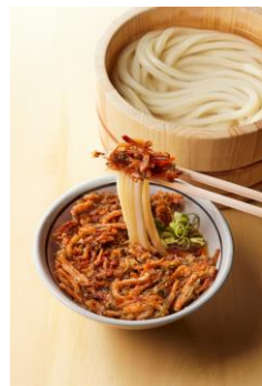
【福島県】 いかにんじんのかき揚げつけ汁

福島の郷土料理「いかにんじん」をかき揚げに。細かくカットしたにんじんの甘みとするめいかの旨みが染み込んだ奥深い味わいに。サクサクかき揚げをそのまま楽しむもよし、浸して打ち立てうどんと一緒に楽しむもよし！