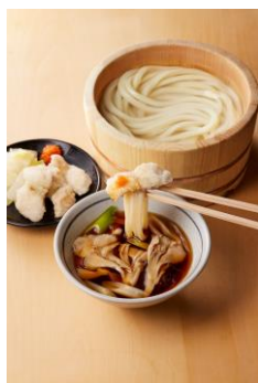
【山口県】 ふぐの天ぷらつけ汁

まいたけの香りが広がる醤油ベースのつけだしに打ち立てうどんをくぐらせ、さっと茹でた白菜と紅葉おろしと一緒にふぐ天をお楽しみください。