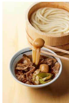
【山形県】 芋煮つけ汁

地鶏の旨みたっぷりのだしに、食感と香りが楽しいまいたけ、長ねぎ、ぷりぷりの鶏肉を入れて炊き上げています。もちっとしたきりたんぼは、そのまま食べてもだしに浸して食べてもお楽しみいただけます。