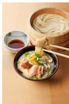
【福岡県】 水炊き鶏つけ汁

カツオには醤油をベースにしょうがの下味をつけ、竜田揚げに。大根おろし、野菜かき揚げと共に打ち立てうどんをお楽しみください。