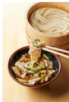
【沖縄県】 アグー豚つけ汁

アグー豚の甘みと旨みが効いた具だくさんのつけだし。旨みをたっぷり含んだ油揚げと長ねぎとアグー豚は、打ち立てうどんとの相性も抜群。ゴーヤの天ぶらを添えることで苦みもアクセントに。