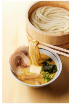
【青森県】 味噌カレーミルクつけ汁

味噌のコクとミルクのまろやかさを楽しめる、青森県のご当地料理。カレーのスパイスさがプラスされることでうまみの強さが後を引くおいしさです。チャーシュー、バター、わかめ、メンマと具だくさんのつけ汁を打ち立てうどんと共に楽しめください。