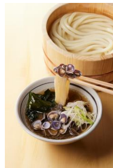
【島根県】 だしの旨みたっぷりしじみつけ汁

ずわい蟹をほぐし身にし、香り豊かな白だしをベースに、しいたけの旨みを加えた玉子あんと合わせました。蟹の旨みと打ち立てうどんをシンプルに楽しんでいただける一杯です。