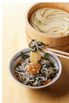
【和歌山県】 紀州南高梅しらすわかめつけ汁

粘りが強く、弾力ある大和芋をたっぷり使用。だしの香りとおさのりの香りと共に、とろろと温泉玉子を打ち立てうどんと絡めて楽しみください。