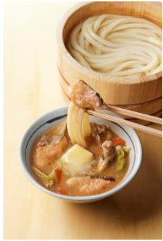
【北海道】 石狩鍋風つけ汁

北海道の郷土料理である石狩鍋をつけ汁にアレンジ。秋鮭を3切、そしてたっぷりの野菜。コクと旨み溢れる味噌だしが打ち立てうどんに絡み体の芯から温まる一杯です。