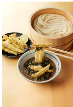
【滋賀県】 わかさぎ天ぶらつけ汁

さくつとフワつとした食感が楽しいわかさぎの天ぶらを山盛りで！徳島県産のすだちをしぼってそのままお召上がりいただくこともできますが、魚介の旨み、のりの香りが楽しい濃厚だしに打ち立てうどんを絡ませ、ぜひわかさぎ天と一緒に楽しみください。