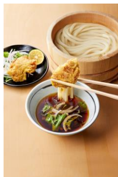
【大分県】 鶏天つけ汁

有頭海老を一匹贅沢に天ぷらにして使用。濃厚な海老の旨みが詰まったつけ汁にのりを加え、海鮮の旨みを存分に楽しんでいただける一杯です。