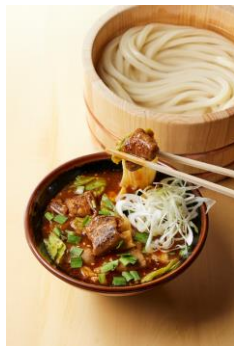
【岡山県】 ホルモン焼きつけ汁

ぷりっぷりの食感がたまらないホルモンの旨みと、ジューシーな脂が口いっぱい広がります。甘辛のつけ汁がもちもちの打ち立てうどんと絡むことで、コク深い味わいに仕上がっています。