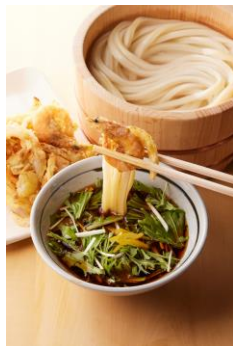
【佐賀県】 芝えびのかき揚げつけ汁

殻付きの芝えびを使用し、かき揚げに。打ち立てうどんとシャキシャキな水菜、玉ねぎの甘さと芝えびの香ばしさをお楽しみいただけます。最後に柚子の香りが鼻から抜け爽やかさも感じていただけます。