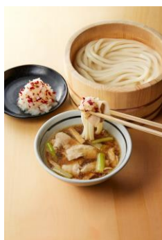
【香川県】 香川本鷹おろし豚つけ汁

濃厚な豚骨しょうゆをベースとしたつけ汁に、甘辛く煮込んだ豚バラ肉、卵黄を乗せてご提供いたします。豚バラ肉に卵黄を絡め、打ち立てのもちもちうどんと豪快にお召し上がりください。