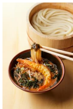
【熊本県】 濃厚有頭えびつけ汁

九州各地で楽しんでいる「だご汁」をつけ汁にアレンジ。肉団子をカラッと揚げてから豚肉、にんじんやゴボウが入ったつけ汁で炊き上げています。すりごまの香りもお楽しみください。