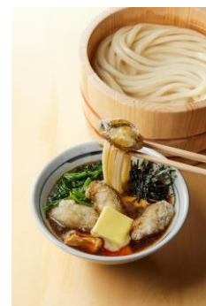
【広島県】 牡蠣バター醤油つけ汁

甘さを引き出したクリーミーなポターージュつけ汁に、甘い玉ねぎ天をゴロっと3つ。オリーブオイルとブラックペッパーを仕上げにかけることで、コクをさらに感じていただける仕立てに。濃厚ポターージュは打ち立てうどんとも相性抜群。