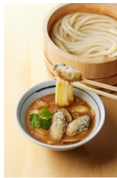
【宮城県】 牡蠣の仙台味噌つけ汁

シャキシャキと食感が楽しいきゅうりと、甘く味付けされた挽き肉が、もちもちの打ち立てうどんと絡み合い、うまいの三重奏を奏でます。温泉玉子を加えて、桶の湯を少し入れてお召し上がりいただくことで盛岡グルメのじゃじゃ麺のメ風に。もう最後まで箸が止まりません。