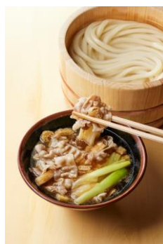
【鹿児島県】 黒豚肉つけ汁

豚肉・にんにく・玉子・ニラの旨みが相まったつけ汁。旨み溢れる辛さは打ち立てもちもちのうどんによく絡み箸が止まらぬうまさです。