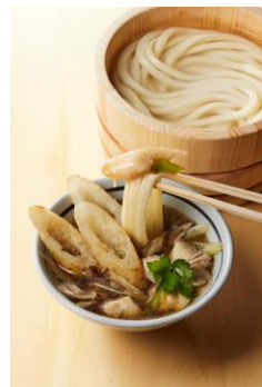
【秋田県】 きりたんぼつけ汁

ぷりぷりの牡蠣を揚げることで旨みをギュッと閉じ込めました。仙台味噌は旨みが濃く、芳醇。味噌の旨みが打ち立てうどんと絡みます。