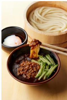
【岩手県】 温玉じゃじゃ麺つけ汁

味噌のコクとミルクのまろやかさを楽しめる、青森県のご当地料理。カレーのスパイスさがプラスされることでうまみの強さが後を引くおいしさです。チャーシュー、バター、わかめ、メンマと具だくさんのつけ汁を打ち立てうどんと共に楽しめください。