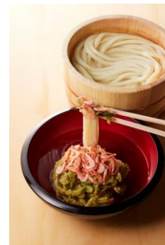
【静岡県】 桜えびと茶葉衣のかき揚げつけ汁

納豆、とろろ、オクラのネバネバとした食材をたっぷり使ったつけ汁。醤油ベースの濃いめのつけ汁に、魚粉を加えることで、打ち立てうどんにしっかりと絡み、いくらでも食べられる味わい。