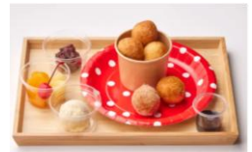
※各コースの写真はイメージです

複数の特別なトッピングやソースをご用意します！あなただけのオリジナル『丸亀うどんーなつ』をご自由に楽しんでいただけるコース。うどん生まれの新食感、もっちもちの「丸亀うどんーなつ」を食べて、笑顔になりましょう！