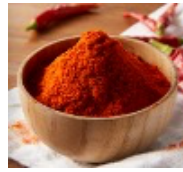
辛さの決め手カイエンペッパー