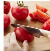
酸味と甘みの主役トマト