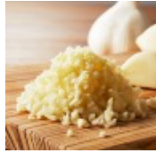
“ガツンと旨い”の源ニンニク