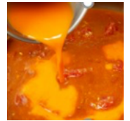
全体をまとめる溶き卵