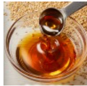
香り豊かなごま油