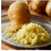
ピリッと刺激のあるしょうが

香りと辛さのベースに丸亀製麺特製のカレールーと白だしを入れ、フレッシュなトマトを加えることで、だしの旨みと香り、そして爽やかな酸味をプラス。仕上げに溶き卵でまろやかさとコクを加えたら、これまでになかった味わいに。やみつきになる、ガツンと旨いカレーとなっています。