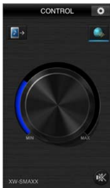
【ボリューム調整画面】