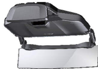
【欧州で発売する車載用HUD】 (欧州製品名称:NavGate HUD)

昨今、国内外のメーカーが車載用ヘッドアップディスプレイ(HUD)を発表・発売するなど、HUDは次世代の車載用ディスプレイとして注目されています。当社は、2012年7月に、業界で初めてAR情報をフロントガラスの前方に映し出す車載用HUD「AR HUDユニット」を日本で発売しました。当社のサイバーナビに接続して使用する同ユニットは、フルカラーのAR情報をフロントガラスの前方に37インチ相当の大きさで表示する先進的で実用的な車載用ディスプレイとして、多くのお客様から高い評価を受けています。