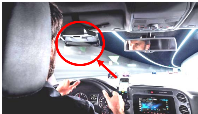
【スマートフォンのナビアプリから必要な情報を取り出して表示】

パイオニアは、スマートフォン連携タイプの車載用ヘッドアップディスプレイ(HUD)の販売を、10月より欧州地域で開始します。