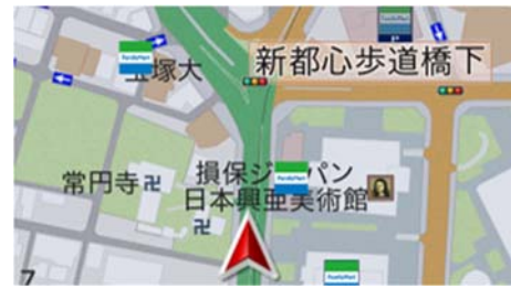
【カンタンモード 地図表示】