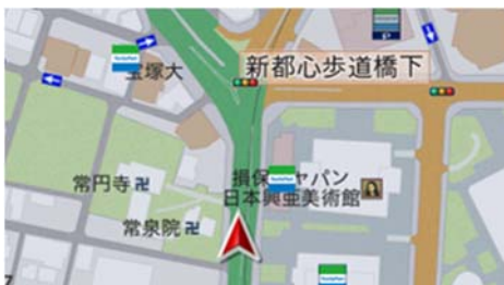
【おすすめモード 地図表示】