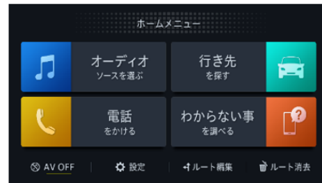
【カンタンモード HOME メニュー】