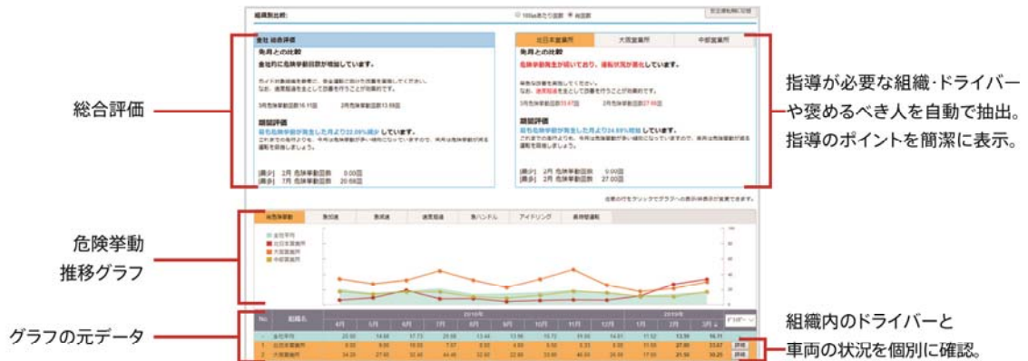
【安全運転支援レポート表示イメージ】