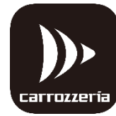
【DiXiM Play for carrozzeria アプリロゴ】