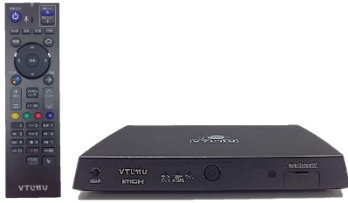
【ひかり TV 対応チューナー「ST-4500」】