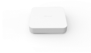
【ドコモテレビターミナル 02】