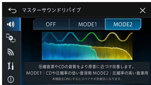
【マスターサウンドリバイブ設定画面】

ディスプレイに高精細 HD パネルを採用し、HD 解像度へのフル対応を実現。地図表示はもちろん、ストリーミングによる映像コンテンツやテレビなどさまざまな映像ソースを高精細かつ高コントラストな描画で、繊細な色彩を忠実に表現します。また、ハイレゾ音源の再生に加え、独自の「マスターサウンドリバイブ」機能を搭載しているため、CD や圧縮音源だけでなく、ネットワーク動画や DVD/SD/USB などの映像ソースの音までもハイレゾ音源相当にアップグレードし、臨場感あふれる音で再生します。