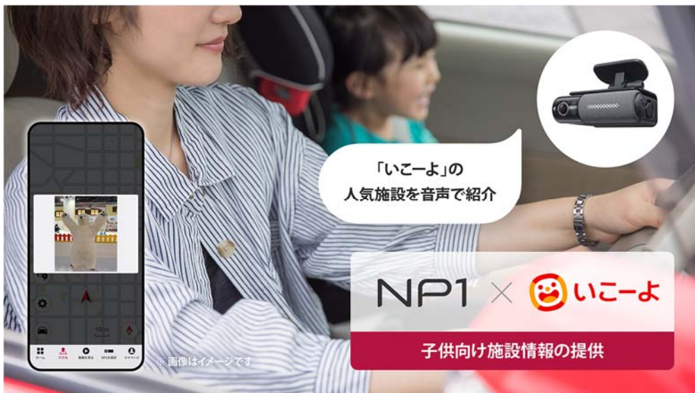
【施設情報提供イメージ】

AI搭載通信型オールインワン車載器「NP1」とスマートフォン専用アプリ「My NP1」に「いこーよ」が提供するコンテンツを組み合わせ、ドライブ中だけでなく、ドライブ前後も快適かつ満足度の高いサービスを提供します。取り組みの第一弾として2023年2月27日よりサービスを開始します。