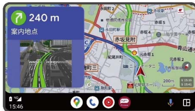
【Android Auto™ 画面イメージ】