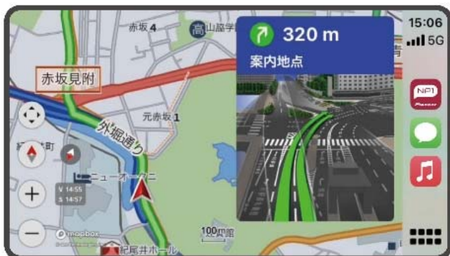
【Apple CarPlay 画面イメージ】

「NP1」と連携して使用するスマートフォン専用アプリ「My NP1」と、Apple CarPlay/Android Auto™に対応したカーナビやディスプレイオーディオなどを、USB ケーブルもしくはワイヤレス※3 で接続することで、「My NP1」の地図や誘導・案内を大画面に表示し※4、タッチパネルで直感的な操作が可能になります。