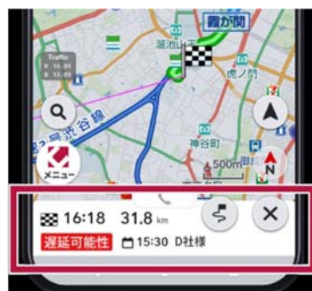
【遅延の可能性表示】