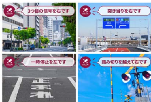
【分かりやすい音声案内】

「COCCHI」は、パイオニアがカーナビメーカーとして培ってきた技術やノウハウを活用したスマートフォン専用カーナビアプリです。運転中에서도見やすい地図表示や、道路幅や信号の数、交差点の曲がりやすさまで考慮した質の高いルート探索、信号や踏切などを目印に適切なタイミングで発話する音声案内などの高精度なナビゲーション機能や、運転中の困りごとやトラブルをサポートする「ドライバーアシスト機能」を搭載しています。月額350円(税込)の基本プランは「Apple CarPlay」「Android Auto™」に対応しており、ディスプレイオーディオと連携できるほか、効率的なスケジュール管理ができる「仕事オプション」(月額300円/税込)や、配送・送迎用途に便利な「ゼンリン住宅地図オプション」(月額1,050円/税込)を追加することもできます。