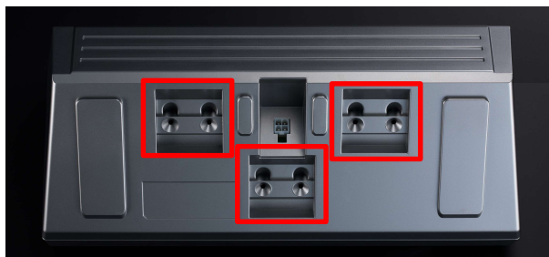
【位置を選べる、3カ所の取付金具設置部】

取付金具の設置部を中央・左右後方の3カ所に設けることで、片側寄せや前寄せなど多様なレイアウトに対応。リアトレイなどを挟み込んで固定する取付金具を同梱しているほか、スピーカー・イルミネーション配線にはコネクター式を採用しており、幅広い車種で確実かつスムーズに取り付けられます。