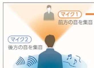
前後2つのマイクで集音