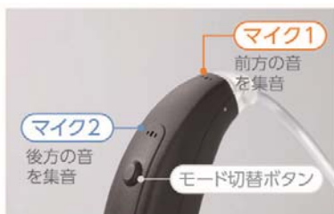
前方と後方の音を聞きわける 2種類のマイクを搭載

本機は2つのマイクを内蔵しています。前方のマイクが前からの音を拾い、後方のマイクが雑音を認識し、逆位相の波形の音を出して騒音を打ち消すことにより、騒がしい環境下でも前方からの人の声が聞き取りやすくなる「スピーチフォーカス機能」を搭載しています。