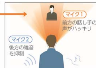
後方の雑音を抑制 * して 前方の話し手にフォーカス