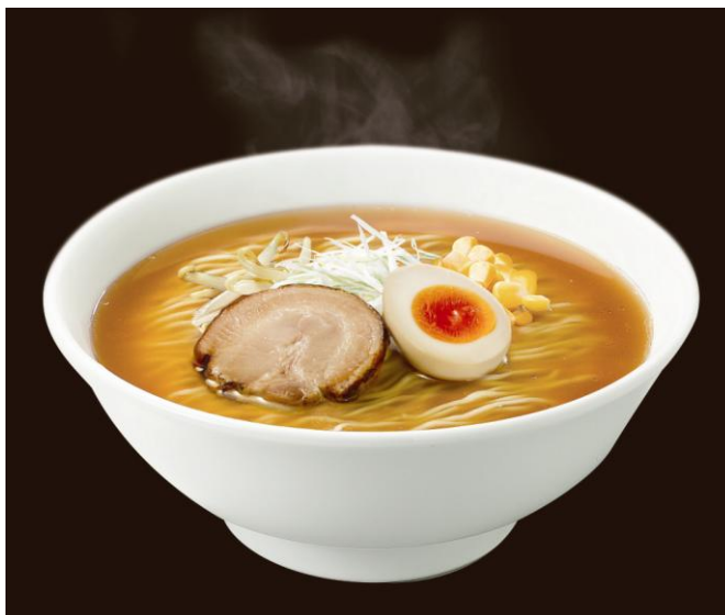
日清ラ王 味噌(イメージ) 250 円(税込)

※高解像度デジタルデータをご用意しておりますので、下記(『日清ラ王 袋麺』PR事務局)までご連絡ください。