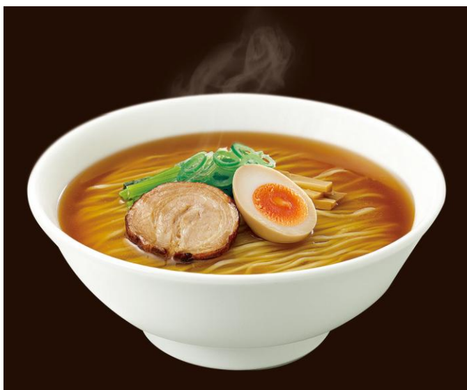
日清ラ王 醤油(イメージ) 250 円(税込)