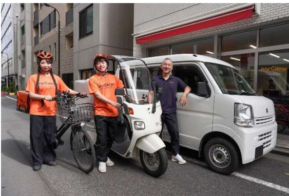
<エニキャリアの配達員（イメージ写真）>