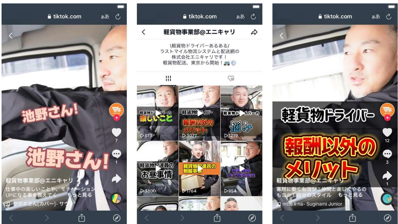
＜エニキャリTikTok公式アカウントの画面イメージ＞

エニキャリTikTok公式アカウント： https://www.tiktok.com/@keikamotsu.anycarry