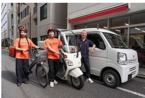
<エニキャリの配達員（イメージ写真）>