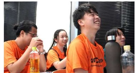
プレゼンを聴くエニキャリア社員ら