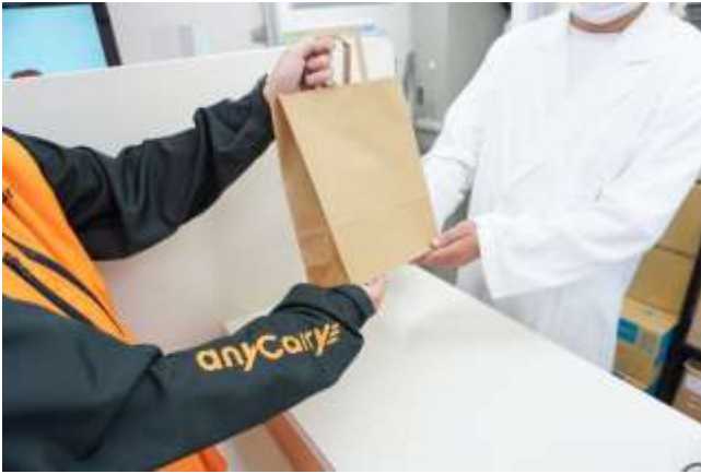
＜薬局での受け取りの様子（イメージ写真）＞