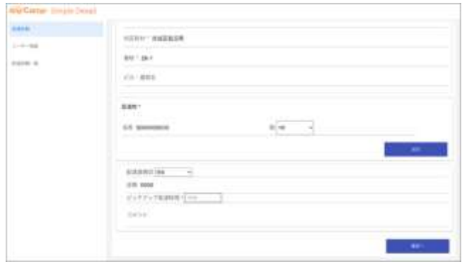
＜お届け先情報を入力して依頼を完了するだけ（専用サイトの画面イメージ）＞