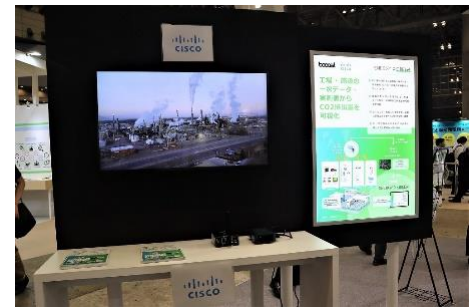
〈シスコシステムズ協業展示エリア〉

当社ブースでは、CO2 等排出量の「可視化」「計画策定」「予実管理・オフセット」「報告レポート」が可能な『ENERGY X GREEN』を展示・パネルやデモで紹介した他、組織の脱炭素化に必要なノウハウや、脱炭素化を推進する各業界の NET-ZERO リーダーに『ENERGY X GREEN』が選ばれる理由がわかるセミナーをブース内にて連日開催しました。さらに今回は、シスコシステムズとの連携の一環として開発を進めている工場・施設の一次データ・実測値から CO2 等排出量を可視化するサービスの展示エリアを新たに設置し、シスコシステムズの説明員と共に詳細を紹介しました。