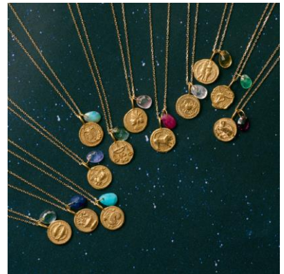
“constallation” necklace 29,700yen (with tax)

12星座のモチーフを繊細なレリーフにした、古代のコインのようなチャームと、星座石チャームをセットにした新作のネックレス。チャームはそれぞれチェーンから取り外し可能なため、お好きなスタイリングでお楽しみいただけます。