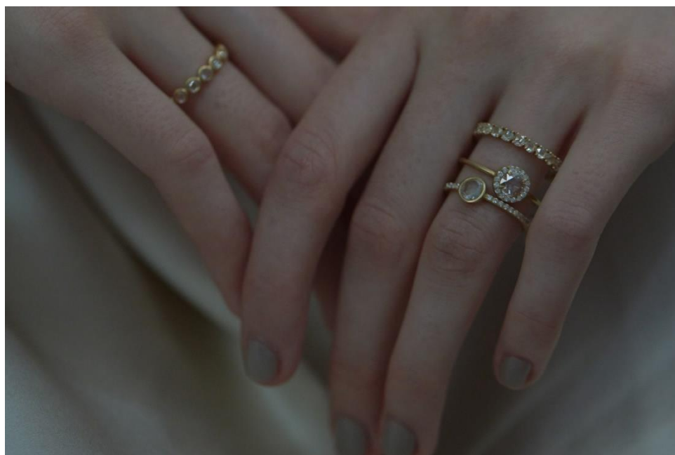
“saphed” 純白の花びら。澄んだ煌めき。永遠の誓い。唯一無二の宝石。