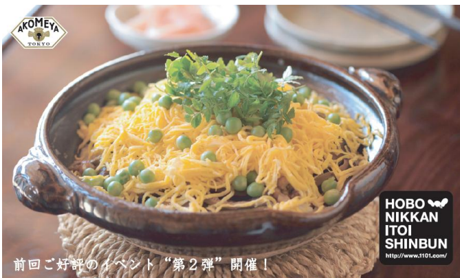
前回大好評のイベント「第2弾」開催!

【参加蔵元】 久保田酒造合資会社 / 舞姫酒造株式会社 / 株式会社本田商店 / 株式会社大田酒造