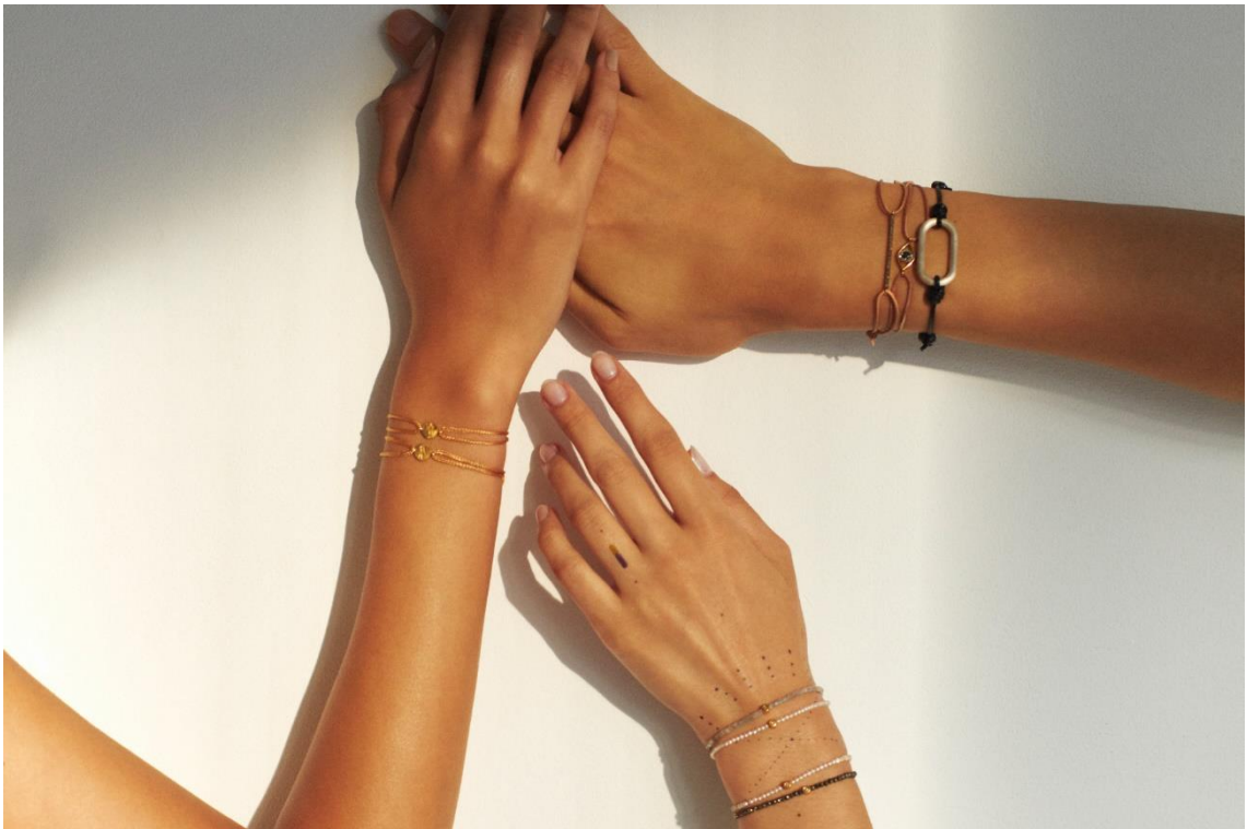
商品1点につき最大1,100円が寄付される、“I am” Donation プログラム

3つの寄付先からお客様が購入時に選択できるシステムにすることで、 ボーダーレスなプログラムへと進化を遂げ、大きくリニューアルいたします。 この「I am” Donation プログラム」を通して、あたたかな支援の輪がさらに広まることを願います。