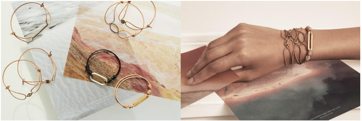
“I am” Donation ヌメ革ブレスレット / 11,000yen (with tax)

10月7日（木）、ナチュラルなヌメ革に9種類のモチーフを添えた、ユニセックスのブレスレットを発売いたします。フォトグラファー Silvia Conde氏のランドスケープシートがアソートでセットに。