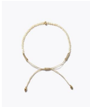
[I am donation] マザーオブパール ダイヤモンド ブレスレット