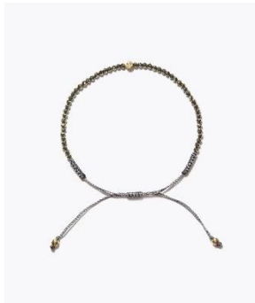
[I am donation] パイライト ダイヤモンド ブレスレット

天然石ビーズブレスレットのクリスマス限定モデルは、覆輪留めしたブラウンダイヤモンドを一粒添えた、シックなラインナップ。パイライト、マザーオブパール、レインボームーンストーン、ケシパールをそれぞれ一連で連ねたブレスレット。