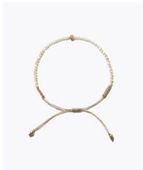
[I am donation] マザーオブパール ケシパール ダイヤモンド ブレスレット