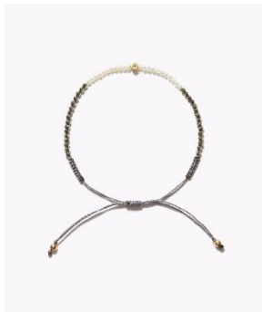
[I am donation] パイライト ケシパール ダイヤモンド ブレスレット

原石に近いグレーダイヤモンドのキューブを連ねた特別なブレスレットは、¥44,000 (税込) のうち¥10,000が寄付されるスペシャルモデルです。