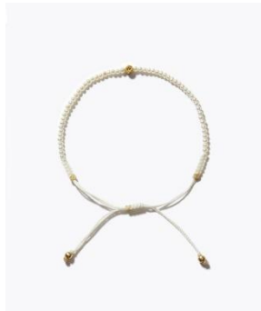
[I am donation] ケシパール ダイヤモンド ブレスレット