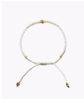
[I am donation] レインボームーンストーン ケシパール ダイヤモンド ブレスレット