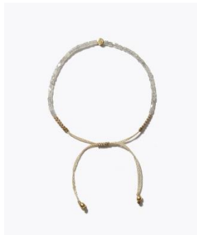
[I am donation] キューブ グレーダイヤモンド ブレスレット