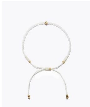
[I am donation] レインボームーンストーン ダイヤモンド ブレスレット