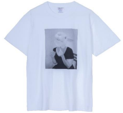
↑「オリジナル特製 T シャツ」（非売品）