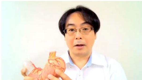
講師自身が撮影・編集を行ったPR動画