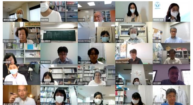
講師全員が映像クリエイターのセミナーを受講