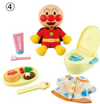
④ ©やなせたかし／フレーベル館・TMS・NTV