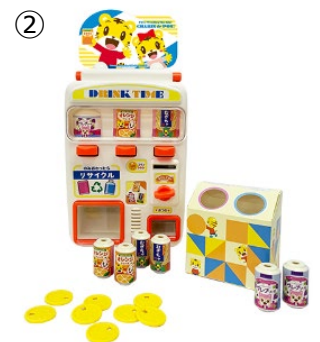
② / しまじろう