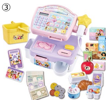
③ © Disney