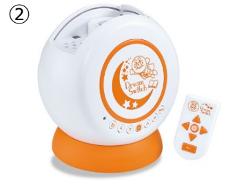
② ©やなせたかし／フレーベル館・TMS・NTV