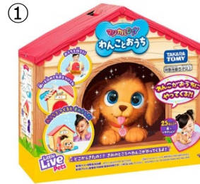
① © T O M Y ©2024 Moose. All rights reserved.