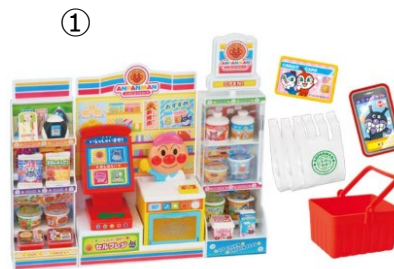
① ©やなせたかし／フレーベル館・TMS・NTV