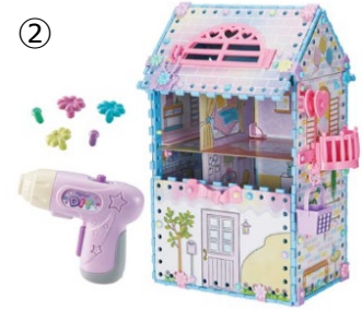
ドリーミーDIY® ねじハピ®