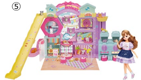
⑤ © TOMY