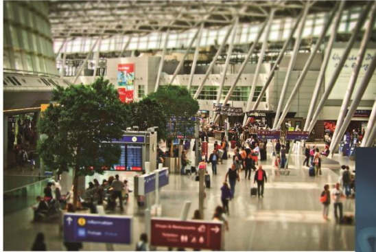
空港、商業施設出入口