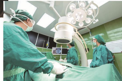
病院、クリニックなど