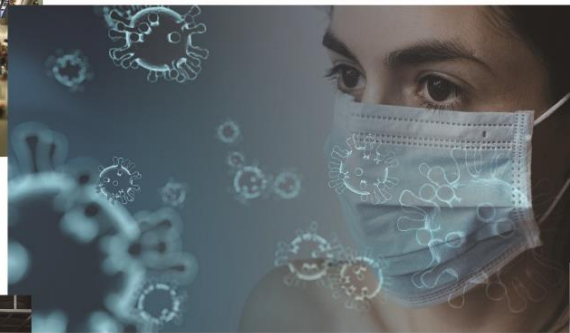
新型コロナウイルスの予防