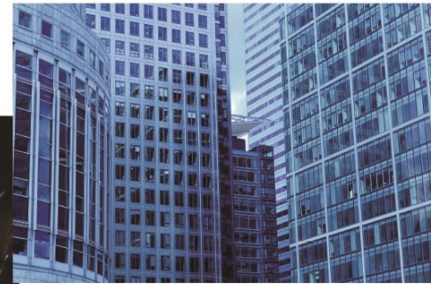
オフィスの出入口