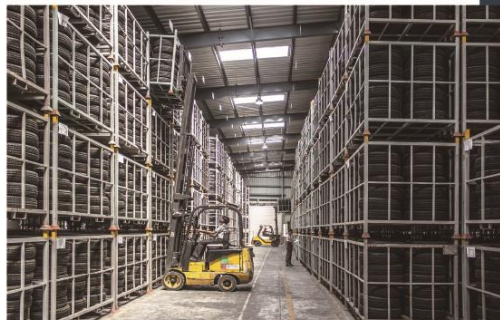
工場、倉庫などの出入口