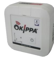
傾斜監視クラウドシステム 「OKIPPA」