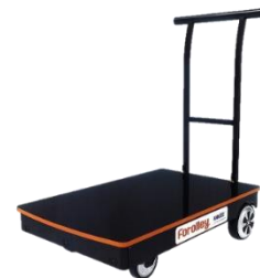
半自動ロボット運搬台車 「フォロリー」