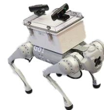
遠隔操作犬型ロボット (参考出品)