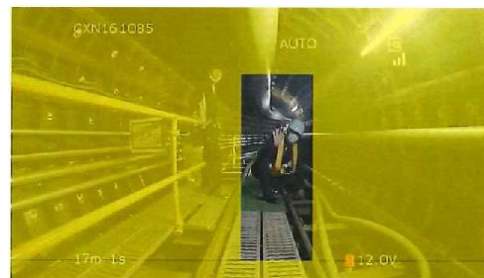
写真-4 マスク画像処理