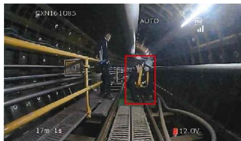
写真-5 軌条内のみ人物検知