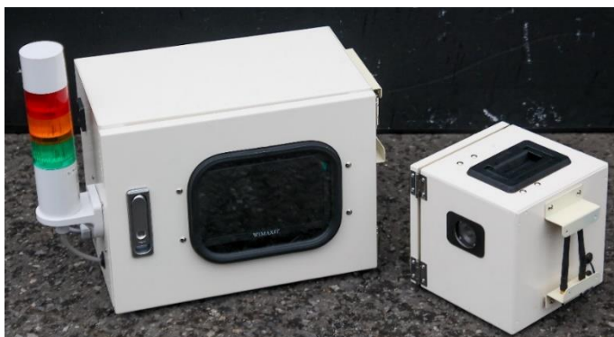
写真-1 カメラユニット(右)と監視モニターユニット(左)