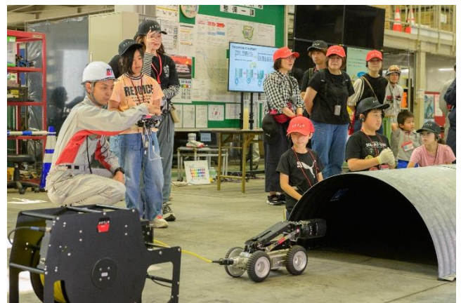
風力発電のブレード内部点検に使う パイプクローラーの操縦体験