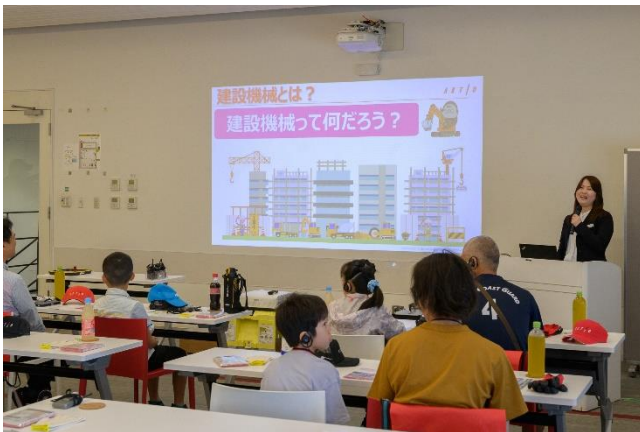
建設業界・建設機械の社会での役割と アクティオの SDGs への取り組みを説明