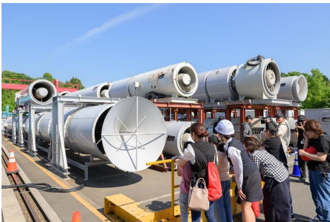
大型ファンによる暴風体験