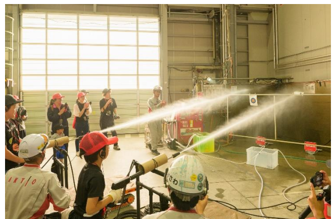
海水淡水化装置と 高圧洗浄機での射的体験