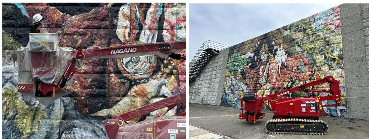
アクティオの高所作業車に乗り、壁画を描く様子