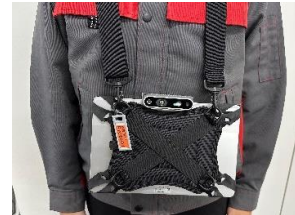
【ストラップ付保護カバー】