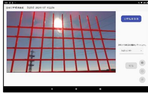
【逆光でも計測可能】