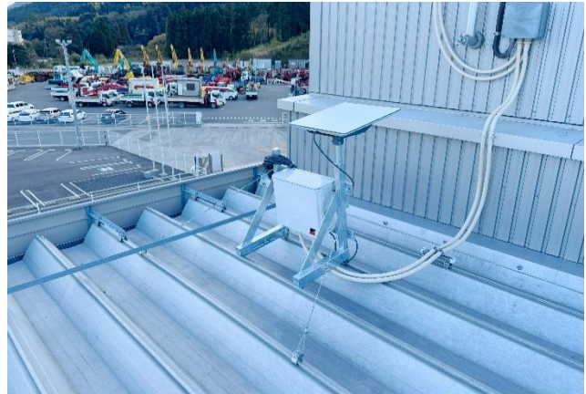
【九州テクノパーク統括工場 鹿児島始良工場 設置風景】

近年、豪雨や大雪、地震などの自然災害が各地で頻発しています。災害時には、電話やインターネットへのアクセス集中や、倒木・積雪などによって電力線や通信ケーブルが断線されてしまい、基地局が機能停止し通信障害が発生しやすくなります。このような状況では、行政機関との連携が困難になり、必要な情報が届かず救援や復旧などの大幅な遅延が懸念されます。