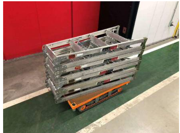
大きな荷物の運搬が可能