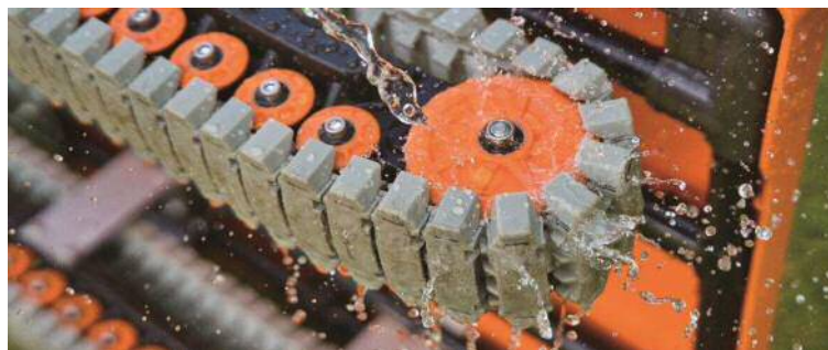
クローラー部分の丸洗い可能