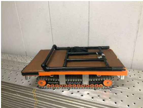
ハンドルは取り外し可能