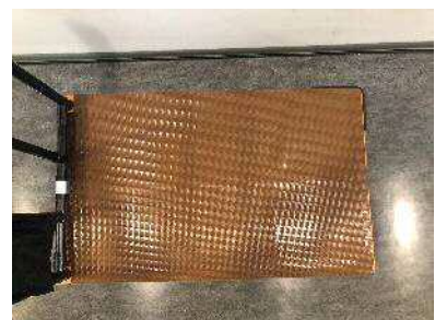
滑り止め天板カバー