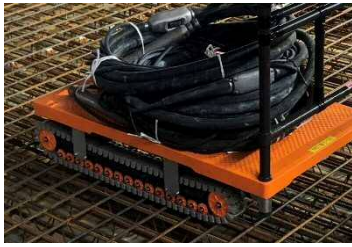
配筋の上も走行可能