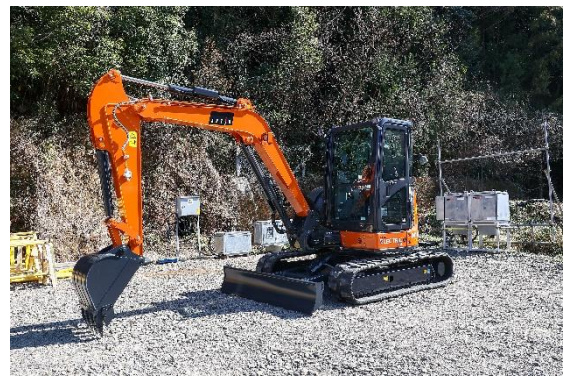
長崎県諫早市の本明川ダム工事で稼働を開始