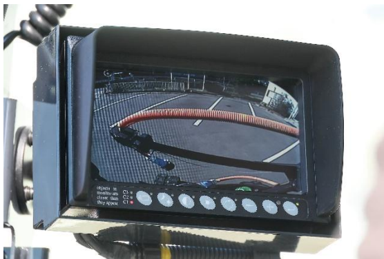
ケーブル確認用補助モニタの搭載