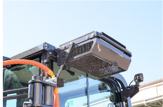
エアコンを標準装備したキャブ