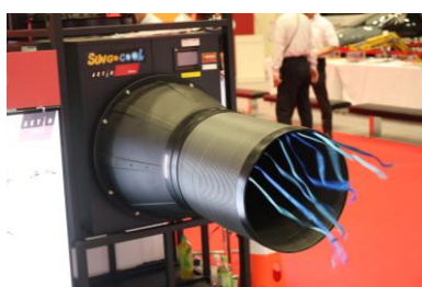
SUN GO COOL

【冷える〜む 3】冷房機能付きテント型休憩所です。アルミフレーム採用で超軽量、組み立てが簡単。さらに、テント同士を連結して広さを自由に調整できるため、用途に合わせた柔軟な空間作りが可能です。