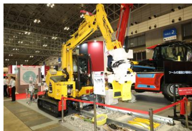
軌陸バックホーアタッチメント G4-III