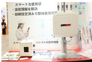
玉掛合図無線システム

【サイレントシステム】建設現場での騒音問題を解決する工具・工法です。「解体・撤去」「運搬」「下地・仕上げ」といったリニューアル工事のほぼ全工程において、騒音を抑制した施工が可能です。