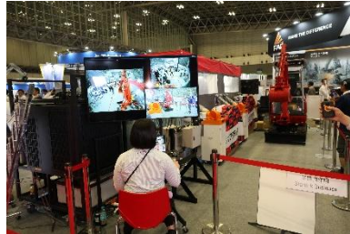
遠隔操作システム×GX 建機