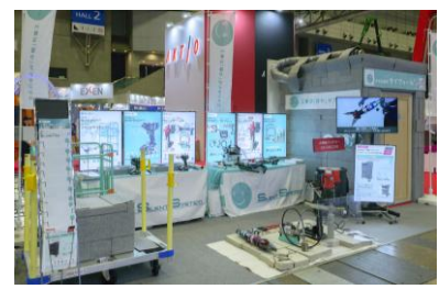
サイレントシステム