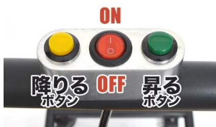
ボタン式で簡単操作